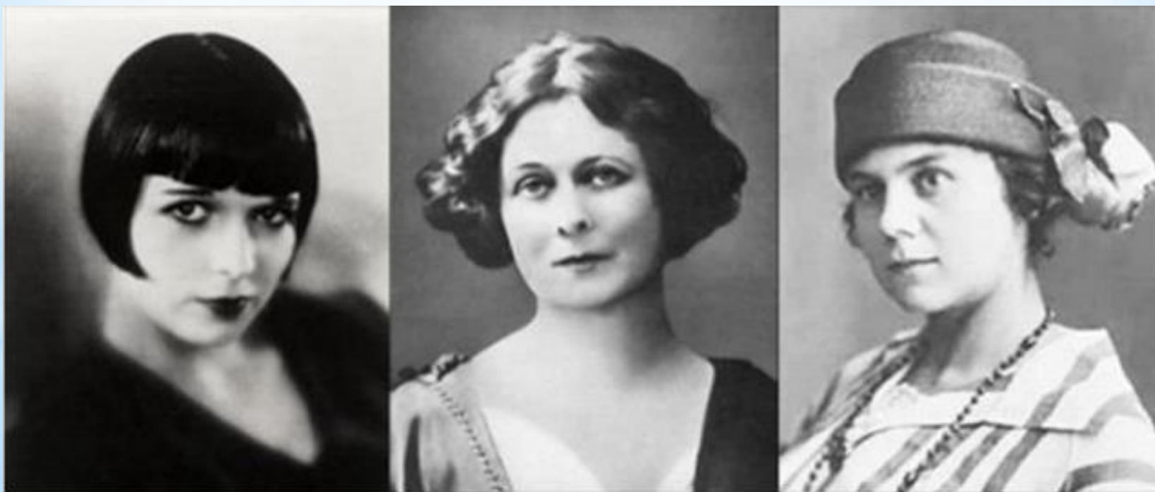
Жёны Есенина (слева направо) - Зинаида Райх, Айседора Дункан и Софья Толстая

Сергей Есенин был влюбчивым и страстным человеком. Известно о его многочисленных романах с женщинами. Есенин, благодаря своей красоте поэт с юных лет вызывал интерес прекрасного пола